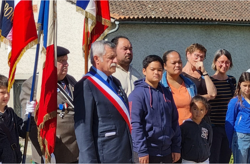
8 mai : cérémonie célébrant l'Armistice de 1918