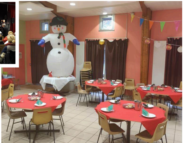
C'est Noël à la cantine