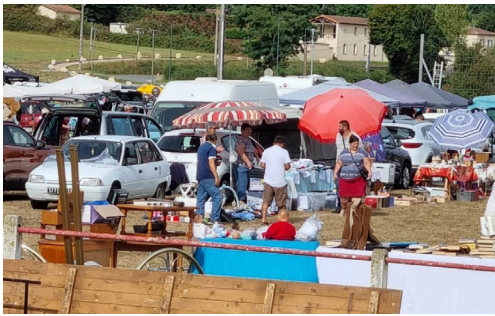
21 août : fête annuelle de Taponnat sous un soleil de plomb