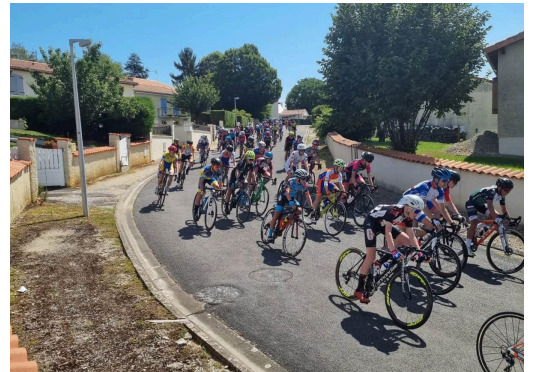
Course cycliste du 25 juillet