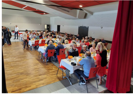
25 octobre : Repas des aînés

En Octobre, La commune s'est mise aux couleurs d'Octobre Rose dans le cadre de la mobilisation mondiale pour le dépistage du cancer du sein.