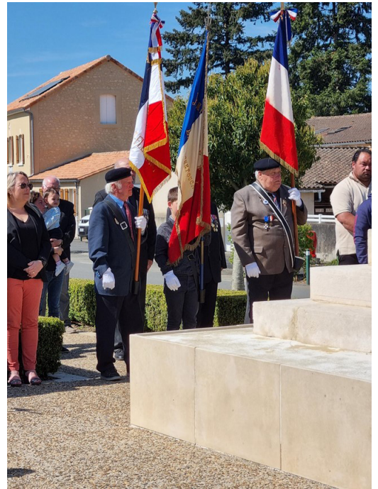
Cérémonie du 08 mai : les deux porte drapeaux de l'UNC TAPONNAT encadrent un jeune écolier de Taponnat portant le drapeau de Maquis Bir Akeim