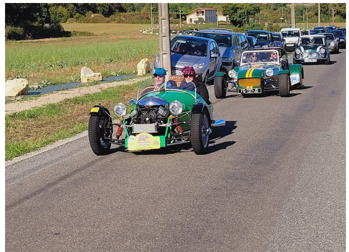
17 septembre : le Circuit des Remparts d'Angoulême fait étape à Taponnat