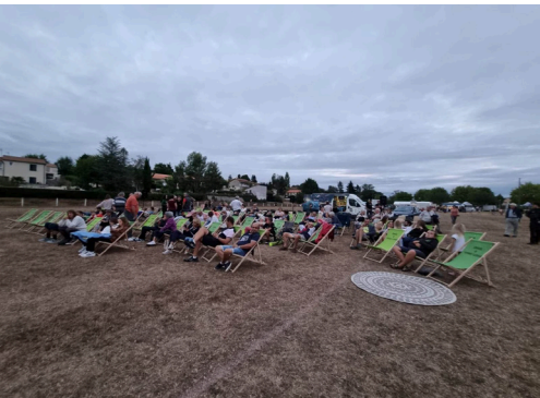
Cérémonie du 7 septembre