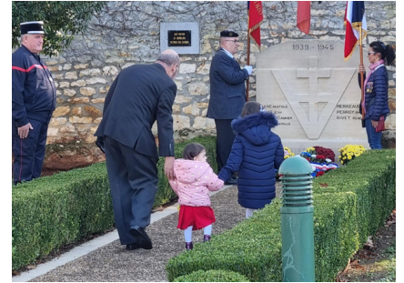
Cérémonie du 11 novembre 2022: Le président de l'UNC TAPONNAT accompagne la plus jeune spectatrice voulant déposer un bouquet de fleurs à la Plaque des résistants .