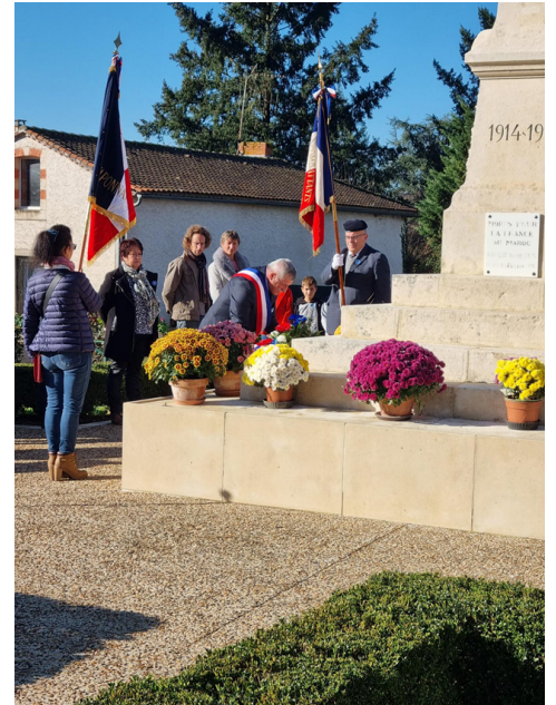
Cérémonie du 11 novembre 2022 : Dépot de gerbe de Monsieur le Maire.