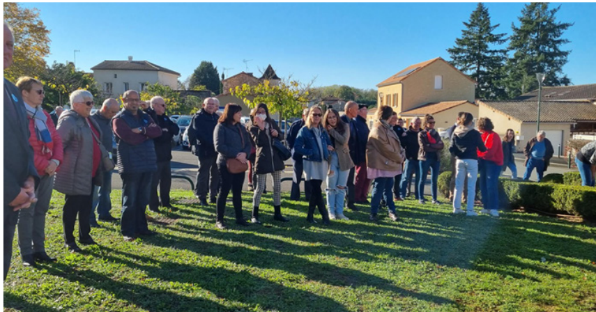
Cérémonie du 11 novembre 2022 Présence nombreuse d'habitants de TAPONNAT.